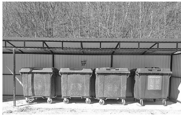
Новая контейнерная площадка на пересечении улиц Металлистов и Новоселицкой

Сейчас по всей стране проходит «мусорная реформа». И каждый из нас может поучаствовать в ее реализации. Достаточно просто складировать мусор в специально отведённых для этого местах и бережно относиться к самим контейнерным площадкам, не опускаясь до вандализма.